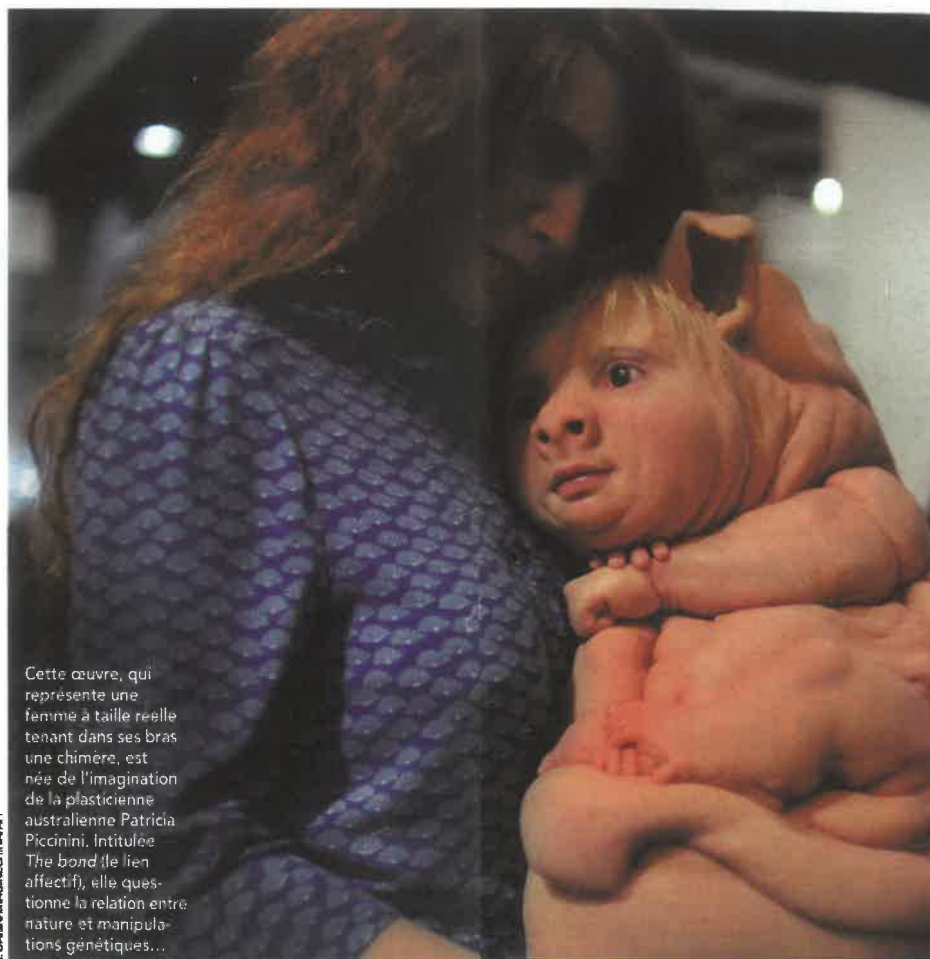
Cette œuvre, qui représente une femme à taille réelle tenant dans ses bras une chimère, est née de l'imagination de la plasticienne australienne Patricia Piccinini. Intitulée The bond (le lien affectif), elle questionne la relation entre nature et manipulations génétiques...